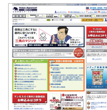
▲ 保険マンモス株式会社 Webサイト