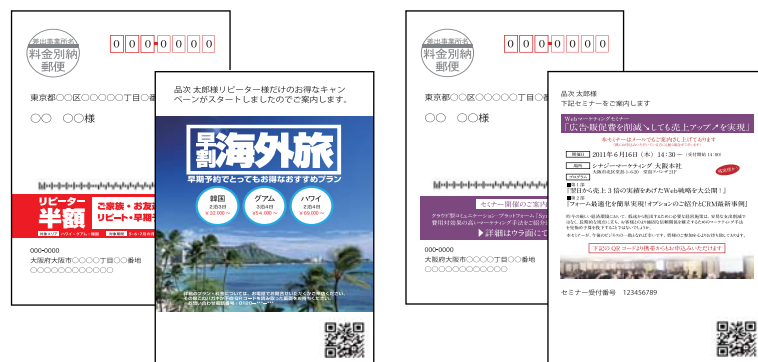
↑ BtoC サンプル：キャンペーン案内